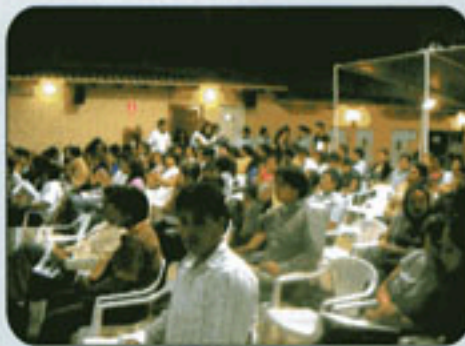
Asociados Asistentes a la Asamblea Inaugural