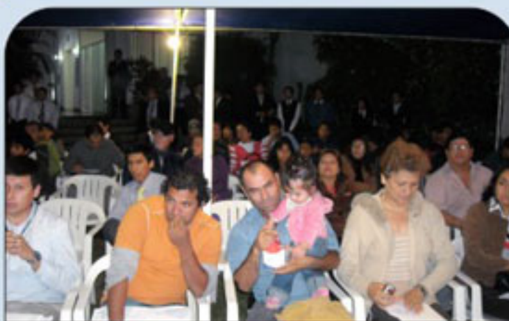
Asociados Asistentes a la Asamblea Inaugural.