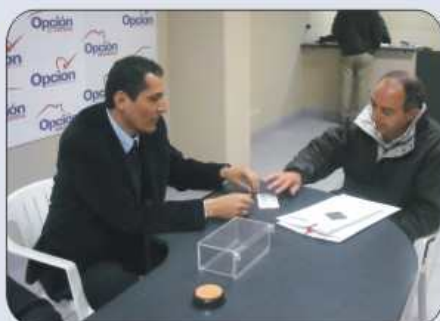
Pack & Films S.A.C. Adjudicado por Remate C.C. 8063.186.01