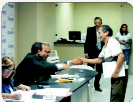
Industrias Químicas San Sebastian S.A.C Adjudicado por Sorteo C.C. 8056.004.01