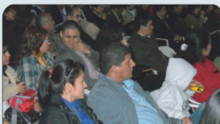
Asociados Asistentes a la Asamblea Inaugural.