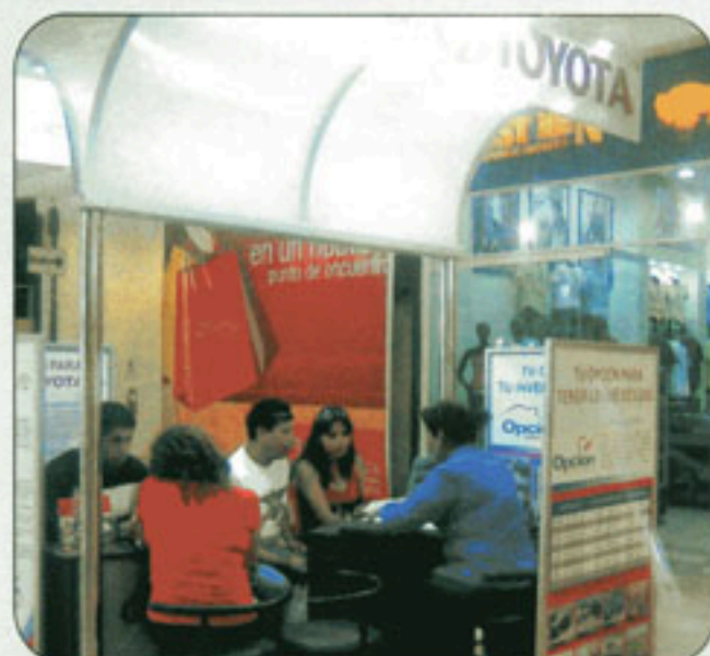
Nuestro nuevo modulo en el Centro Comercial Mall Aventura Plaza Arequipa