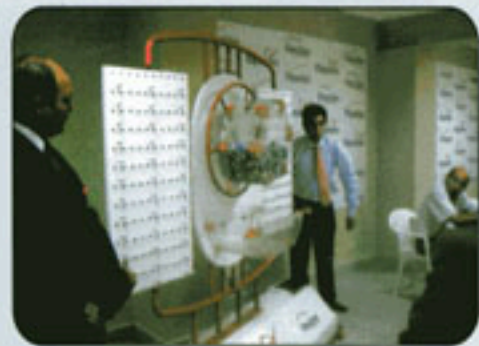
Colocando los Bolos en el ánfora