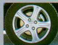
• Aros de Aleación de 15\"/>