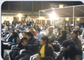
Asociados Asistentes a la Asamblea Inaugural