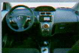
• Tablero con iluminación constante (día/noche) Optitrón. Aplicaciones interiores en color aluminio.

En 1999, Toyota revolucionó la industria automotriz del segmento compacto con el lanzamiento del Yaris. En el 2006 cambia radicalmente su diseño y obtiene una excelente aceptación a nivel mundial. Su diseño aerodinámico, con aspecto deportivo e imponente, la mejora de su sistema VVT-i (mejor eficiencia en consumo de combustible) y su gran espacio interior lo han hecho líder indiscutible de su segmento hasta la fecha en nuestro país. En el 2010 Yaris apuesta por ampliar su portafolio teniendo diversas alternativas para cada necesidad: